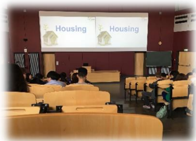
新生訓練－房屋租賃介紹

為了參加學校的新生訓練，因此需要在開學前兩周抵達德國。學校在德國有兩個校區，分別位於 Würzburg 和 Schweinfurt，海大交換計畫的科系都在 Schweinfurt。在 Schweinfurt 城市中又有 campus 1 和 campus 2，兩者距離約 10 分鐘路程。