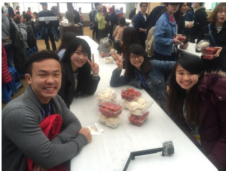
國際處舉辦的體驗活動-採草莓

很開心能在一個舒適的環境中體驗學習，中央大學提供給交換生每學期很多次的文化體驗活動。每學期來說至少三次以上，讓我們能夠接觸韓國的傳統文化或是現在全世界都流行的 kpop，除此之外學校宿舍的交換學生也有一個叫做「Culture program」的文化小組活動，成員是韓國人外國人個半，讓我們有多一些機會接觸不同國家文化互相交流。