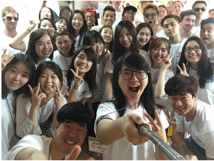
Korean Club MT