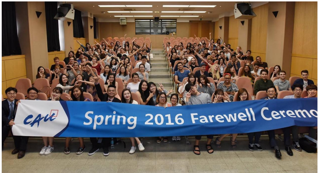
CAU Exchange Students Farewell Ceremony

這些點點滴滴至今回想心裡還是覺得很悸動，如果有機會我也願意把我在韓國的感動分享給每一個人，韓國的交換學生生活絕對是我人生中最棒最棒的選擇，現在我的大學生涯已經到了尾聲，我可以帶著笑容不留遺憾的走向人生的另一個旅程。