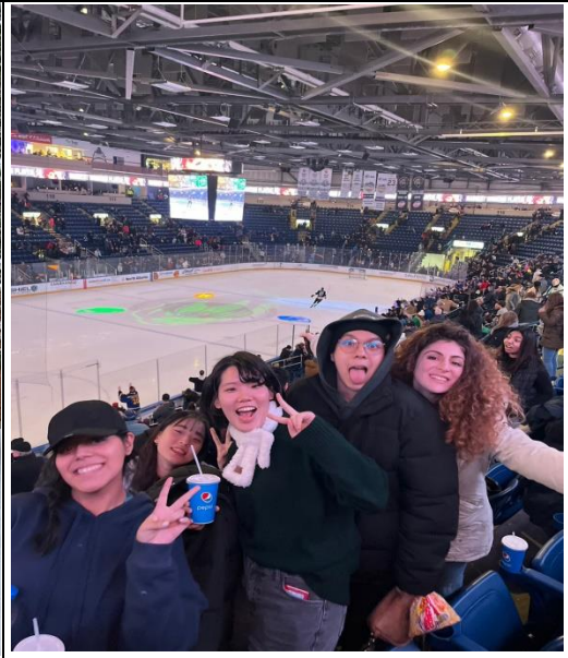
描述：學校舉辦給所有交換學生參加的 hockey game，比賽相當激烈，現場球迷也十分熱情