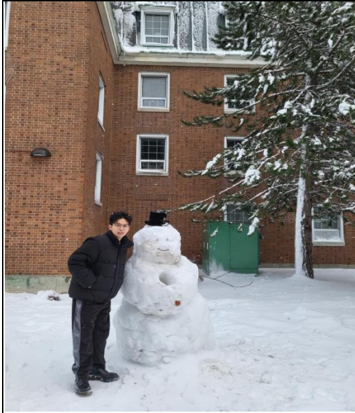
描述：St. John' s 校區冬天積雪相當快速，同學也發揮創自自己堆雪人。