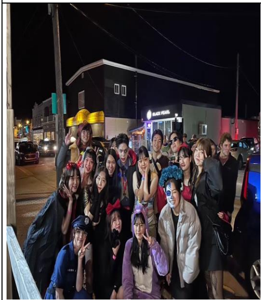
描述：同學們穿上精心打扮，一同慶祝一年一度的萬聖節